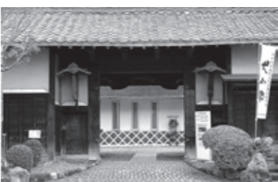
現在のからくり展示館

意見提出先 期間中に住所、氏名と意見を、郵送、ファックス(Fax44-0372)またはEメール(070700@city.inuyama.lg.jp)で歴史まちづくり課へ