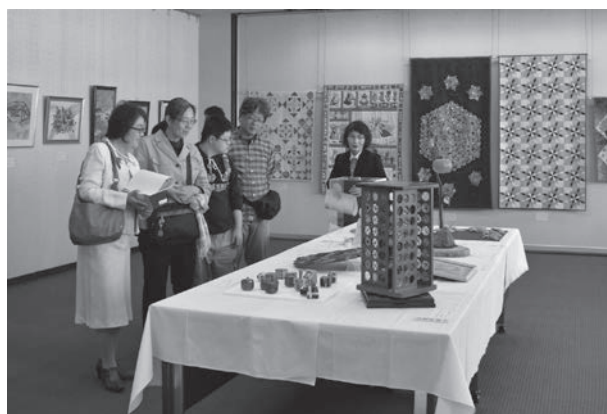
犬山市民展の様子