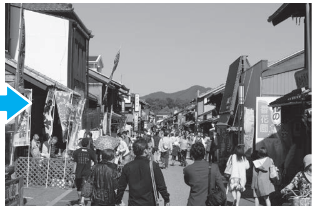
電線類地中化・道路美装化後のにぎわいを取り戻した本町通り