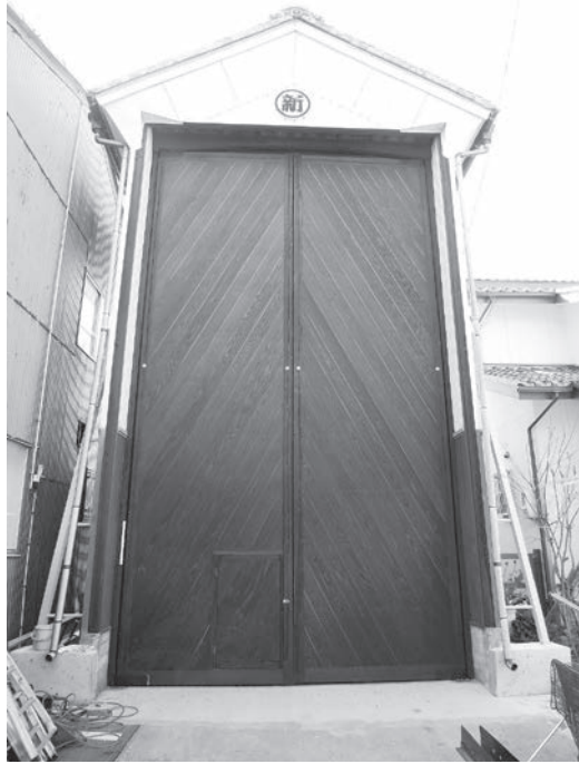
修理事業を実施した新町車山蔵