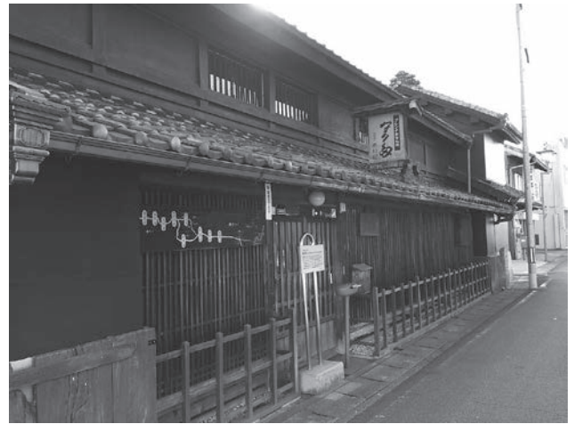
修理事業を実施し活用された事例 (奥村家住宅)