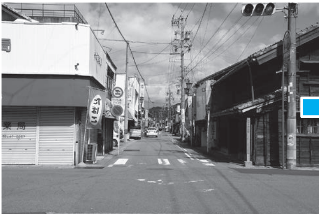
電線類地中化・道路美装化前の本町通り