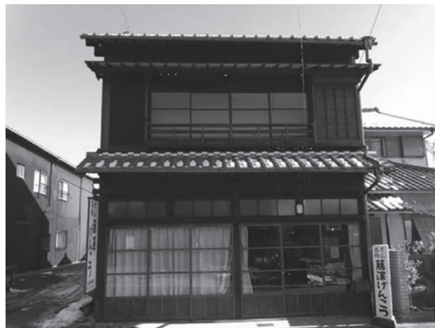
修理事業を実施し活用した事例 (林家住宅)