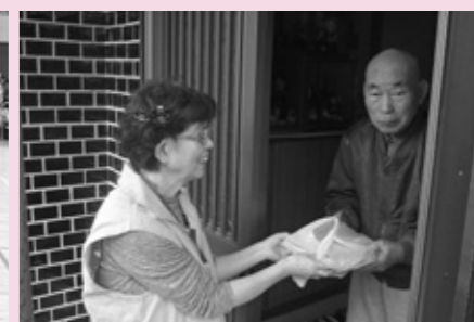
高齢者配食サービス