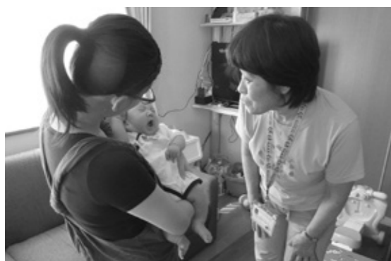
主任児童委員によるベビワン♥訪問

主任児童委員とは 子どもや子育てに関する支援を専門に担当する民生委員・児童委員です。