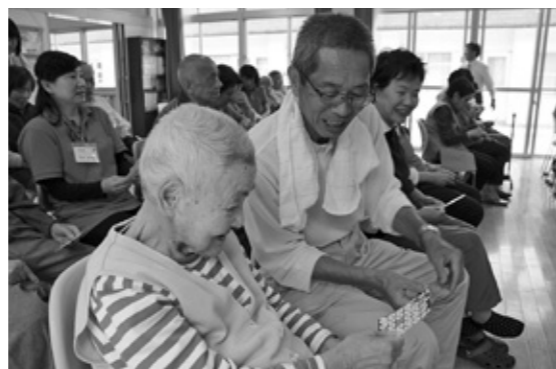
高齢者とのふれあい

主任児童委員とは 子どもや子育てに関する支援を専門に担当する民生委員・児童委員です。