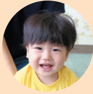
しょうぶ かずし 菫蒲 一紫ちゃん (犬山) 平成28年7月2日生まれ