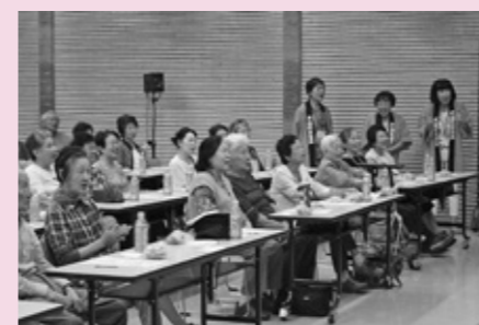
まちなかいきいき茶論

具体的な活動事例 まちなかいきいき茶論（犬山北地区）、まちなかおしゃべりサロン（犬山南地区）、クオリティ大会（城東地区）、青パトによる防犯パトロール（羽黒地区）、高齢者世帯配食サービス（楽田地区）、社会福祉協議会会員募集、赤い羽根共同募金など