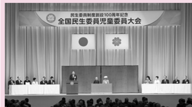
100周年記念式典にご臨席の天皇后陛下

平成29年は、民生委員制度の創設100周年の大きな節目の年となっています。平成29年7月9日、10日には、東京で100周年記念式典が開催され全国の民生委員が2万人近く参加し、天皇后陛下のご臨席も賜り、盛大に式典が開催されました。