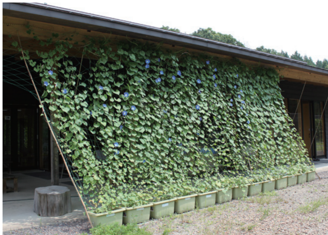
犬山里山学センター

市庁舎をはじめ公共施設で“アサガオ”などのツル性の植物を窓の外に這わせた壁面緑化に取り組んでいます。自然の力を利用した夏場の省エネルギー対策です。