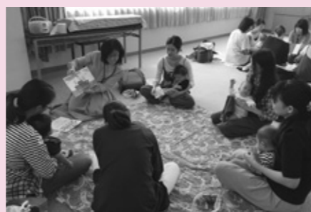
主任児童委員による絵本の読み聞かせ