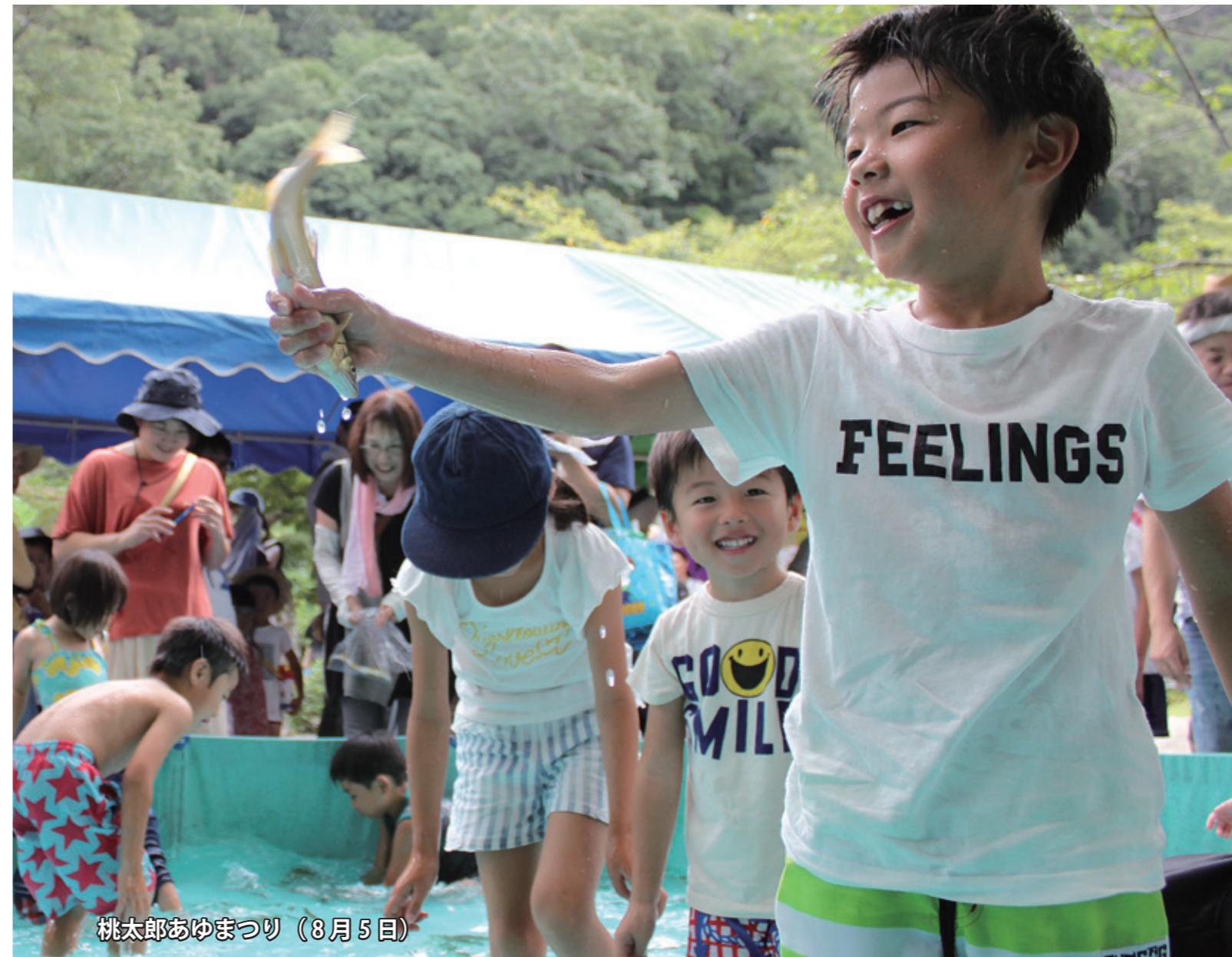
桃太郎あゆまつり（8月5日）