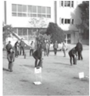
▲昨年の様子(犬山北小学校)

火災予防、火災時の対応に必要な知識や技術を学ぶことを目的として行います。城下町地区以外にお住まいの人も参加できます。 ▼とき 12月4日⑨午前9時30分～11時 ▼ところ 犬山南小学校 ▼服装・持ち物 運動のしやすい服装、軍手、上履き ▼訓練内容 初期消火、防火講話、煙体験、放水体験、AED取り扱いなど ▼問合せ先 消防署警防担当 (☎65・0119)