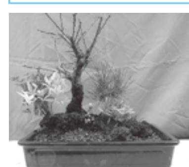
▲松竹梅盆栽(イメージ)

注1：わりばし、ゴム手袋(ビタツとする物)、新聞紙、エプロン 注2：エプロン、ふきん、持ち帰り容器(20×20cm以上)、電動ハンドミキサー(ある人のみ) 注3：エプロン、ふきん、手拭き、持ち帰り容器 注4：ゴム手袋、エプロン(汚れ防止)、はさみ、ビニール風呂敷、ビニール袋(持ち帰り用)