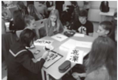
ドイツの学生たちに漢字名を毛筆で書き、プレゼントしました。

10月18日〜27日、中学生4人が犬山市青少年海外派遣事業としてドイツのザンクト・ゴアルスハウゼン市とハレ市を訪ねました。現地の学校で、授業に参加したり、日本文化を紹介したりして、「国際人」としての意識を高める経験をしてきました。