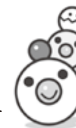
愛知県子育て応援マスコット・キャラクター「はぐみん」