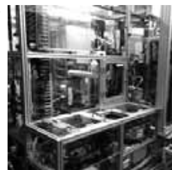
精密部品組付け行程

当社では、「安全を全てに優先する」と宣言し、日々の生産活動を行っています。万が一、普段と違う異常を発見した場合には、ただちに生産ラインの稼働を停止させて安全を確保します。また、不用意に設備に手を入れることがないように、生産設備を扱う全社員に専用工具の携帯を義務付ける等、徹底した安全確保に努めています。