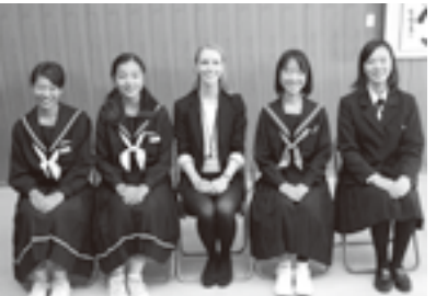
ジャッキー(中央)と派遣された中学生