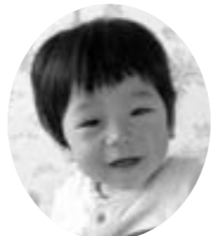
元気にすくすく育ってね。