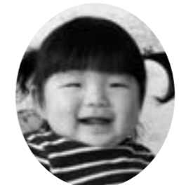
元気で明るい子に育ってね。