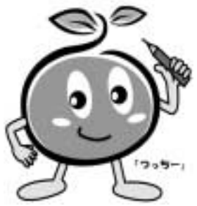
農林業センサスキャラクター

▼問合せ先 愛知県農林生活部統計課 学事・農林統計グループ (☎052・954・6102)、犬山市役所農林治水課 農政担当 (☎44・0342)