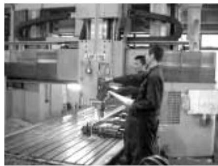
大物加工技術を磨く社員

◆社員一丸で実現する早さ 受注から納品までには様々 な工程があり、それぞれの分 野を専門とする社員が担当し ますが、当社では日頃から数 多くの社内行事を開催するな ど社員同士の親交を深める工 夫をしています。その結果、 分野間の垣根が取り除かれ、 社員が一丸となって仕事に取 り組む職場環境ができあがり、 受注から納品までの期間短縮 に繋がっています。