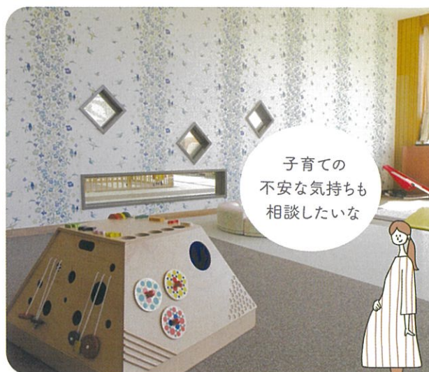
▲赤ちゃんルーム「すずらんの部屋」

0～18歳までの子が遊べる「さんにいれ」で、妊娠期から学童期までの子育て相談ができるようになりました！