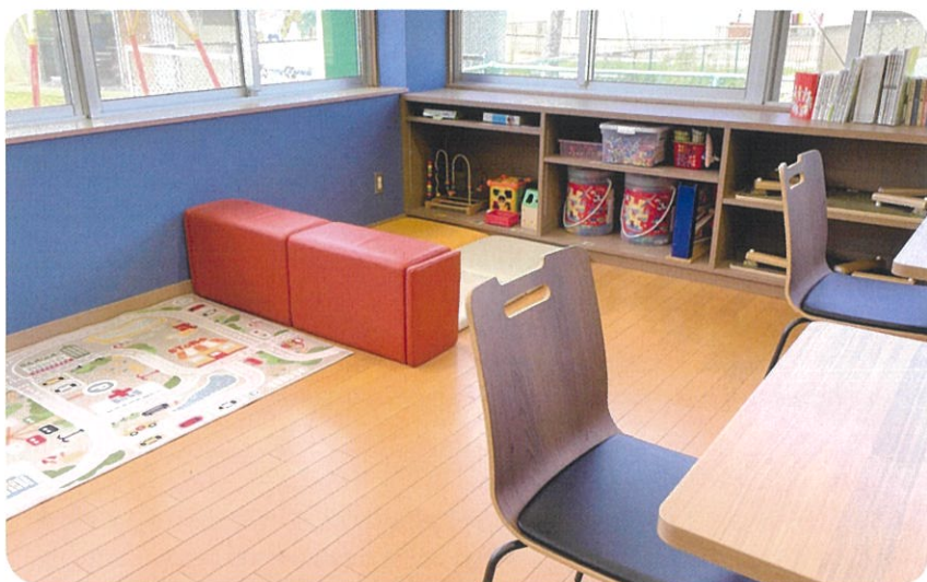
▲「きらっとの部屋」。さんにいれには他にもみんなの広場「ひまわり」など全4つの部屋があります。