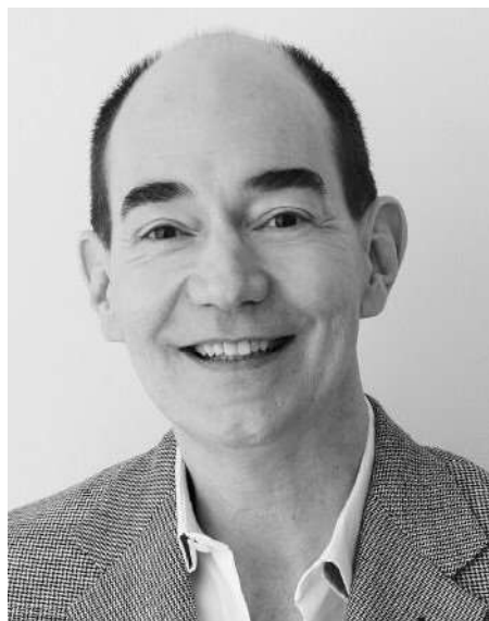
ロバート キャンベル