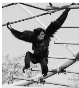
▲フクロテナガザル