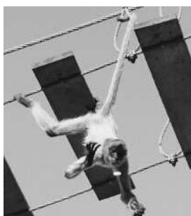
▲ジェフロイクモザル