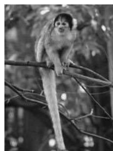
▲ポリビアリスザル