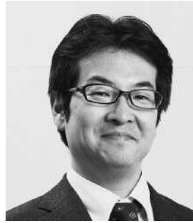
歴史作家 かわい あつし 河合 敦